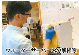
ウォーターサーバーの分解掃除