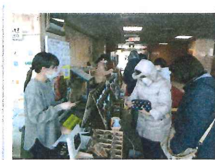
十勝総合振興局でのロビー販売