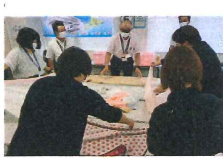
仕事の魅力発見フェスに参加