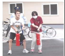
防災訓練 → （消火体験）