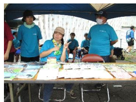
↑お祭りでの出店・販売