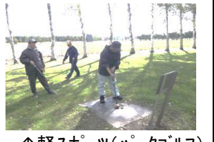
↑軽スポーツ（パークゴルフ）