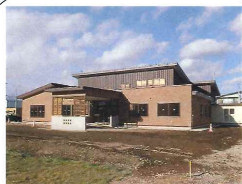
「特別養護老人ホームほほえみ」の北側に位置しています。