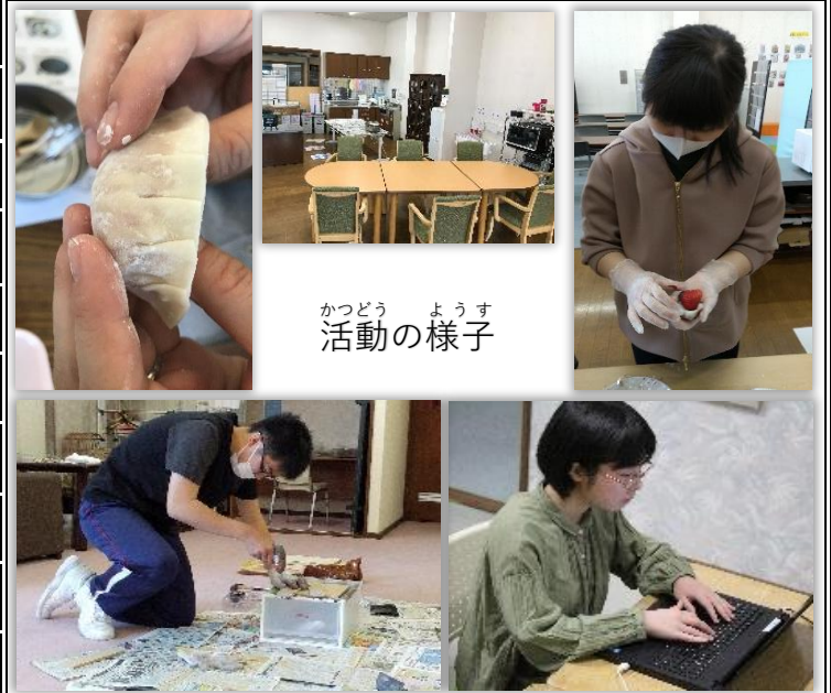
かつどう ようす 活動の様子