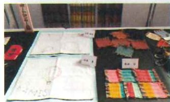
刺し子&さをり織り作品