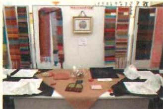
文化祭での手工芸品の展示