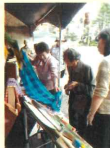
お祭りイベントでの手工芸品販売の様子