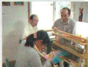
さをり織り作業の様子