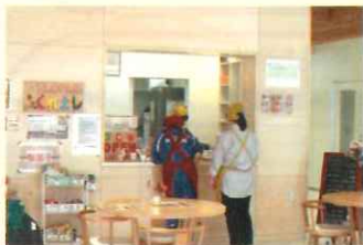
カフェくれよんの様子