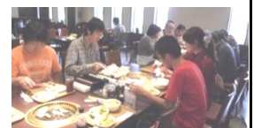
↑ 外出活動 （バイクで食事）