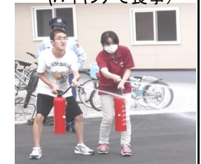
防災訓練 → （消火体験）