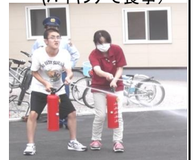
防災訓練 → (消火体験)

普段は午前中は作業、午後は余暇の時間として過ごしています。 午前中に軽スポーツや昼食作りがある日は午後に作業をしています。