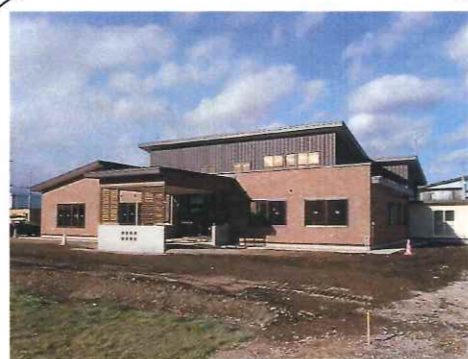
「特別養護老人ホームほほえみ」の北側に位置しています。