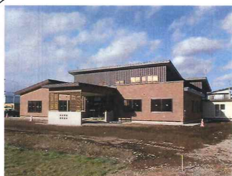
「特別養護老人ホームほほえみ」の北側に位置しています。