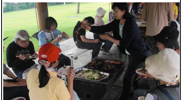
サポートセンター開所記念行事(焼き)

施設外就労として、町内にある生涯学習センター「わっか」にて、清掃作業及びカフェ「くれよん」を営業しています。こちらの作業