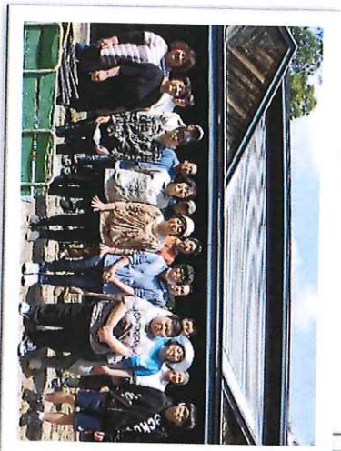
パークゴルフ集合写真