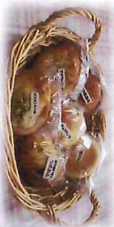
パン お菓子の詰合せ