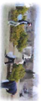
ボラソチエア(美化活動)