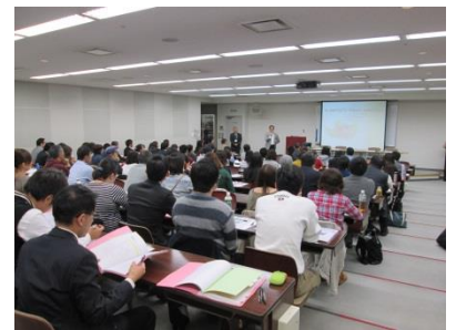
基礎セミナーの受講の様子

アンケートでは「思いや体験から学ぶことが多かった」「働く原動力を考えられた」という声をいただきました。午後はジョブコーチの定義からジョブマッチング、支援方法など、就職につなげるための着目点や就職後の対応まで段階を追って学ぶ内容でした。福祉サービス担当者はもちろん、教育機関・企業の方にも参考になったというご意見をいただいております。