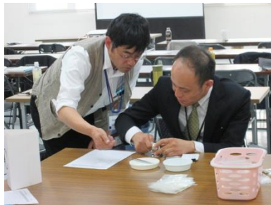
「わかりやすく教える技術」 演習の一場面

1日目の基礎セミナー午前中は地元企画からスタート。当事者の方々の話を伺うことができ、改めて忘れてはならないご本人の気持ちを尊重する大切さを考えることができました。