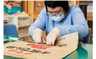
↓クラフトバッグ制作