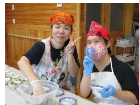
↑調理活動（昼食づくり）