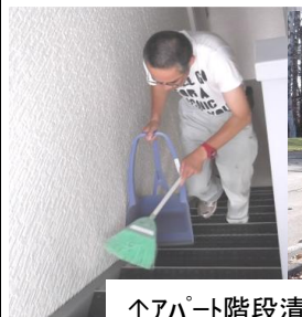
↑アパート階段清掃