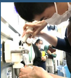
体験は“ミニソフト作り” 緊張しながら頑張りました