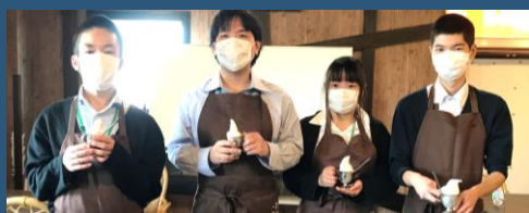
見学後は質問タイム。障がい者雇用されている方の働き方や、仕事内容の決め方、シフトや勤務時間などのお話を伺いました。自分で作ったソフトクリームもいただきました