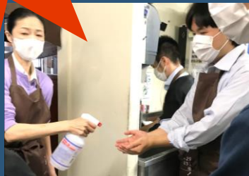
飲食店は手洗い・消毒が基本