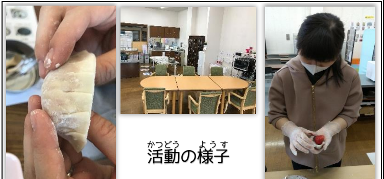
かつどう ようす 活動の様子