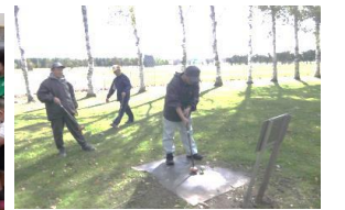
↑ 軽スポーツ（パークゴルフ）