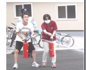
防災訓練 → (消火体験)